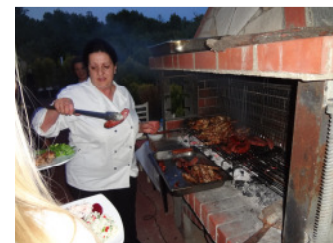
BBQ in lauer Sommernacht

Treibstoff wird gestellt und zwei Ladestationen sind installiert. Tücher und Reinigungsmittel stehen für die Pflege nach dem Flug bereit. Für die weniger geübten Piloten oder für das Üben spezieller Flugfiguren können Flugstunden mit dem erfahrenen Trainer vereinbart werden. Er steht bei allen Problemen mit Rat und Tat zu Seite und hilft beim beheben von Defekten.