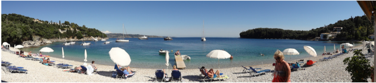
Traumhafte Buchten - Auch so kann Korfu aussehen

Tag ein passendes und dennoch preiswertes Boot chartern. Wer etwas mehr von der Insel sehen will, sollte an den Tagesausflügen teilnehmen. Lassen sie sich von einem einheimischen Fahrer manch unberührte Stelle, abseits vom üblichen Tourismusrummel zeigen. Die Insel begeistert durch ihre üppige Vegetation zu jeder Jahreszeit, ihre himmlischen Buchten und Strände und die Altstadt von Kerkyra mit ihrem ganz besonderen Charme. Es ist für jede Altersgruppe etwas dabei. Abends gegen 21:00 Uhr gibt es Dinner an der gemeinsamen Tafel. Nach dem Essen trifft man sich in der Bar und mit Tischtennis, Billard, Dart, Karaoke, gekühlten Getränken und guten Gesprächen kann man den Tag ausklingen lassen. Dieses Jahr waren wir drei Paare mit ganz unterschiedlichen Erwartungen. Das eine Paar war schon mehrfach im RC-Hotel und hat uns animiert mitzufiegen. Für die beiden anderen war es das erste Mal. Ein blutiger Anfänger, einer der dösengetriebene Flächenmodelle fliegt und ein Profi mit seinen beiden Hubschraubern ( aus Deutschland mitgebracht ). Wir alle waren uns nach einer Woche Corfu einig, das muss man wiederholen. Unter diesem positiven Eindruck haben wir beschlossen diesen Artikel aufzusetzen um auch andere Familien zu